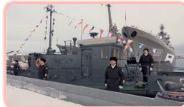
Противодиверсионный катер П-371 Кольской флотилии разнородных сил имени Героя Российской Федерации Романа Манкевича